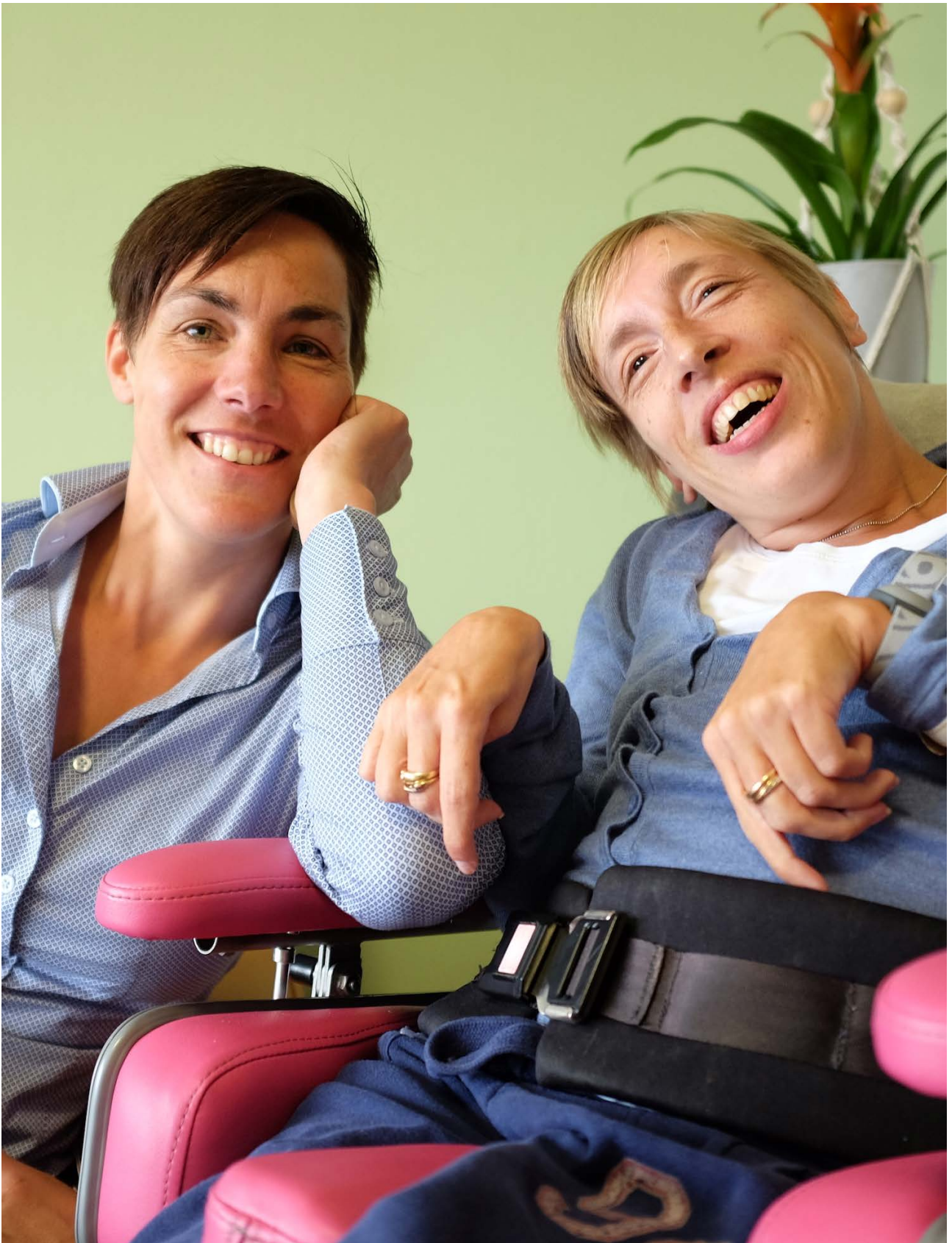
In 2016 opende Rudolf Steiner Zorg in Den Haag 'De Es', een woonlocatie voor mensen met een verstandelijke beperking.