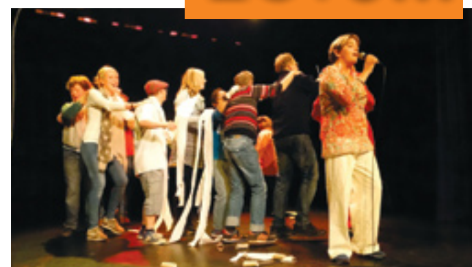
Vierde Scorlewald met allerlei festiviteiten haar 50-jarig bestaan