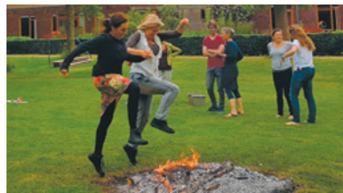
Maakte Queeste de sprong naar zelfondernemen