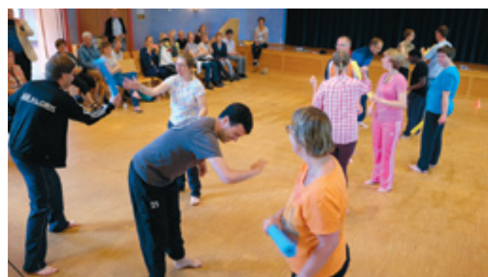
Namen bewoners van Breidablick deel aan de weerbaarheidstraining 'Rots en water'