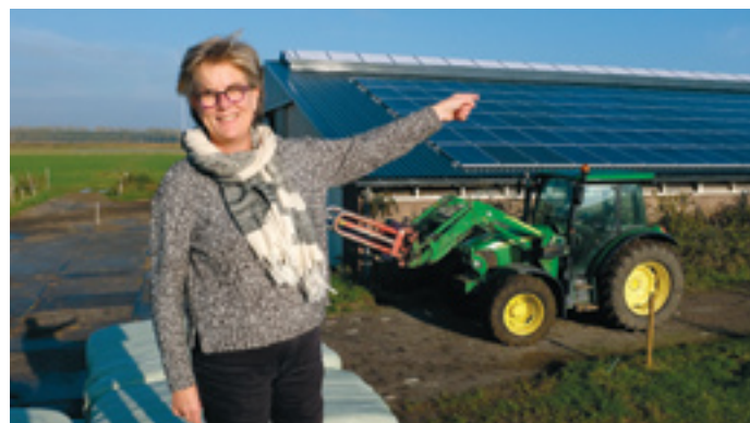
Zorgde het nieuwe zonnepanelendak op Dijkgatshoeve voor een geheel co2 neutrale energiehuishouding