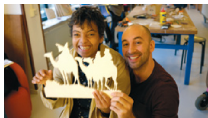
Opende Rudolf Steiner Zorg een houtwerkplaats voor mensen met een verstandelijke beperking