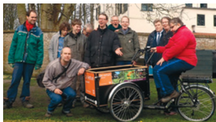
Schonk Rotary Bergen een bakfiets aan De Hoftuin