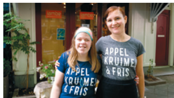
Startten lambe en het modemer Appellkruimel & Fris een samenwerking