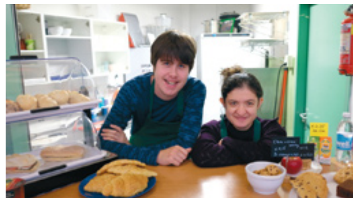
Zocht Rozemarijn versterking voor het Green Canteen-team op het Rudolf Steiner College