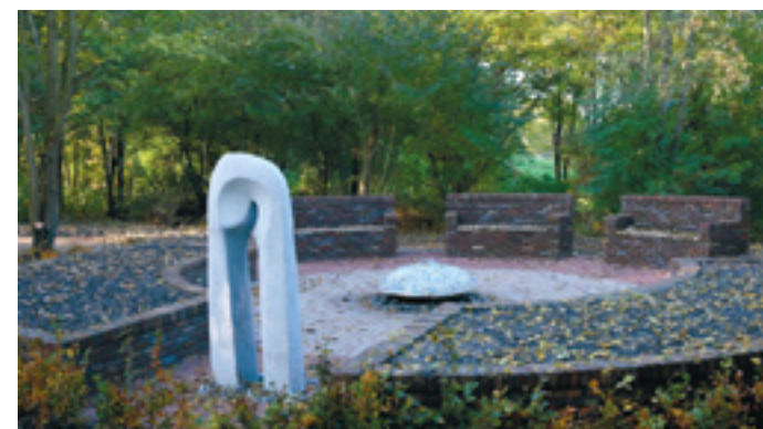
Werd op Midgard de gedenkplaats in gebruik genomen