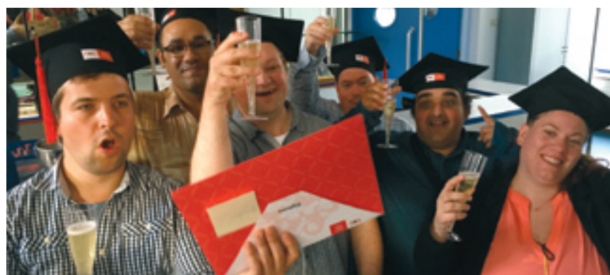
Ontvingen trotse deelnemers van lambe hun diploma Assistent bakker aan het ROC Amsterdam