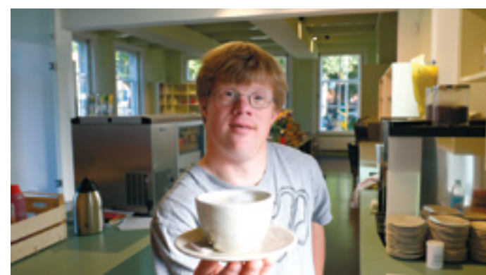
Werden de eerste kopjes capucino geserveerd in winkel/lunchroom De Kosterij in Middenbeemster