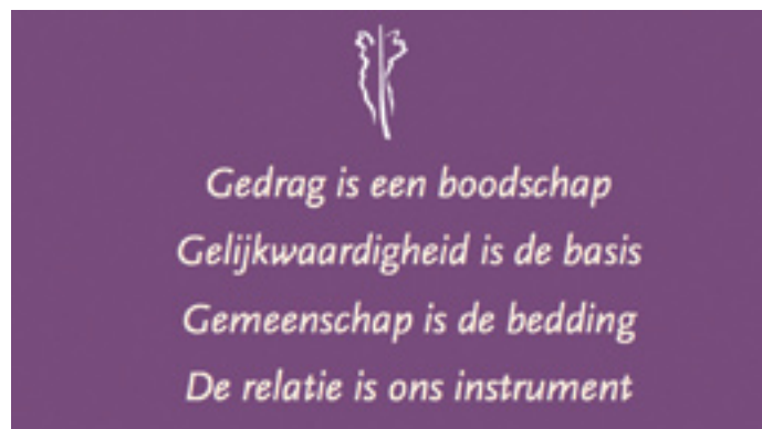
Verscheen een eigen uitgave over moeilijk verstaanbaar gedrag