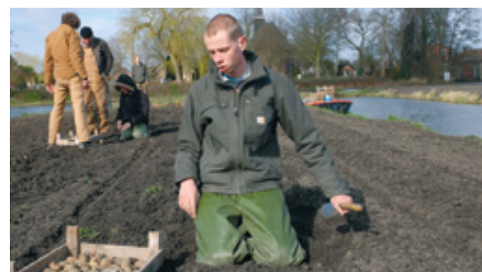
Werden aardappels gepoot op een van de 'werkeilanden' beheerd door Oosterheem