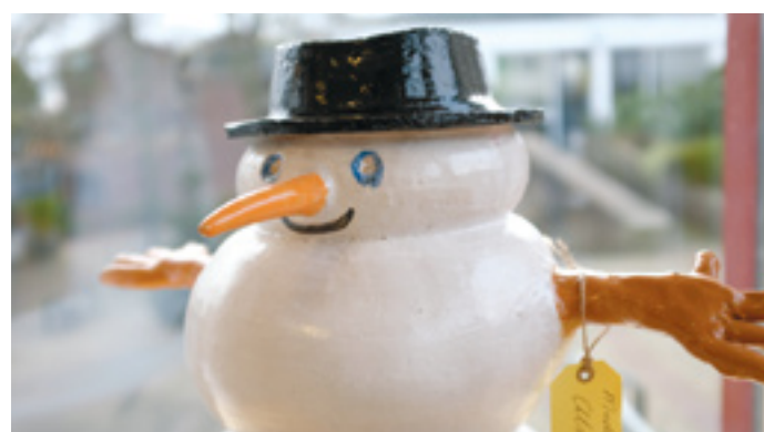
Was deze keramieke sneeuwpop te koop bij Feniks